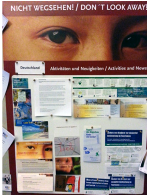
Exhibition "Activities and News – Protection of children from sexual exploitation in travel and tourism" – Germany

The first international meeting took place in Vienna in 2010, followed by the second meeting in Bern in autumn 2011. Already in 2011, other countries (Italy, France and Luxembourg) joined. France and Luxembourg also participated in the meeting in Berlin (2013) and became partner countries of the campaign. In Berlin, the extension of the campaign on additional countries was decided. The agreements of the subject partner countries can be found at point 7.1.1.