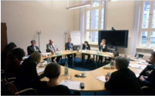
Interdisciplinary Exchange of the Working Group "Public Awareness Raising"

The timely limitation of the initiatives is problematic. To advance the dissemination of the reporting address by the spot and other awareness raising material (e.g. the leaflet "Small Souls – Great Danger") and sensitize as many people as possible for the topic, various options are available: