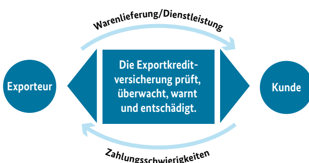
Grafik BMWi, Quelle: Euler Hermes Kreditversicherungs-AG